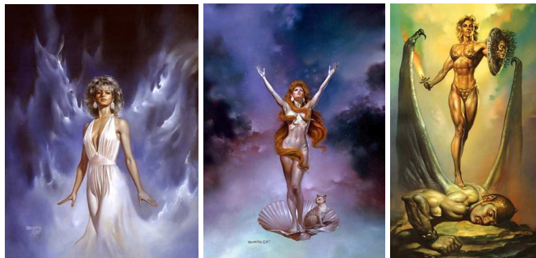
Vallejo képei: a Fehér Hold, a Vénusz, és az Amazon

A karmikus munkához szokott embernek tudni kell: jó is rossz is jön vegyesen, amely hatásokat egyébként nem kellene így megítélni – csak tudnunk kellene, mire használjuk a felkínálkozó időt! Ha jelentkezik egy gond, üdvözölni kell a problémát, és kivallatni a jelképi üzenetet: vajon mire utal, mit üzen? A horoszkóp ábrákon kívül, a fantasztikum világában élő festő, Vallejo és párja, Bell képeit választottam, hogy szemléltessem, hogyan jelenhet meg tiszta minőségben a két energia, és mit tesz, ha keverednek a szerepmínőségek.