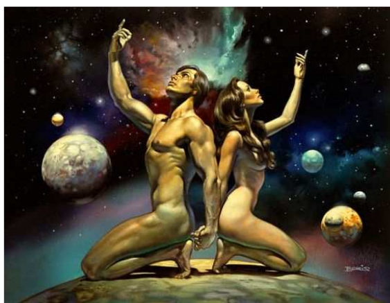
Vallejo: Érjük el a csillagokat

Május vége közeledik, és előző levelemben (elérhető a Hírlevéltárban) a várva várt karmikus megkönnyebbülési lehetőségekről írtam. Életutunkról elgördültek a nehezítő akadályok 2009. május 17-től: az előre induló karma-bolygó, a Szaturnusz segítően figyel, tényleg teszünk-e a javunkért? Most az ASTROLOGIA Elektronikus Magazinban ( ASTROLOGIA E-Zine, copyright: Imolai Judit ) 2009. májusában, e második levélben arról küldök gondolatokat, milyen témákban, mely életterületeken foghatunk cselekvő munkához, ha boldogulásunkat fontosnak tartjuk.