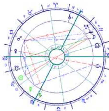
Holdfogyatkozás a Vízöntőben 2009.Aug.6.1:55 Bp.

Fő egyéni munkaterületünk tehát, ahogyan a Napforduló ábrájában a Nap-Uránusz negyedfény előre vetítette, a helyzetünk újraértelmezése, újabb képességvizsgálatok, önismereti gyakorlatok – mihez lehetne fogni, mivel kell szembesülni, hogyan kell azonnal változni. Életünknek praktikus területein segíthet az újrakezdés, eredeti ötletek felvállalása, független gondolatok kezdeményezése, kreatív ötletbörzék . Lelkiségünket legáldásosabban a pszichológiai alapú foglalkozások gondolhatják, melyek segítenek az átváltozás folyamataiban, a megértésben és a lelki elfogadásban.