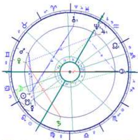
Teljes Napfogyatkozás a Rákban 2009.Júl.22.1:54 Bp.

Különös nehézséget jelentenek értelmezésben az asztrológiai számíthatóság határán a Napfogyatkozás (július 22.) és a Holdfogyatkozás (augusztus 6.) időpontjai, hiszen az időpontok biztosan kalkulálhatók, de az égi jelenség okkult természetét tekintve, a hatásuk nem. Az Oroszlán-Vízöntő pólus jelentését tekintetbe véve, az ország vezetővel – emiatt az irányítással - kapcsolatos fontos változásokat várjuk , melyek egyértelműen az emberek lázadásának hangulati nyomása alatt fognak bekövetkezni. Sajnos bármilyen erőteljes változás következik be, sokáig csak a rendszerelenség és a kiürült tartalékok fogják uralni az időt.